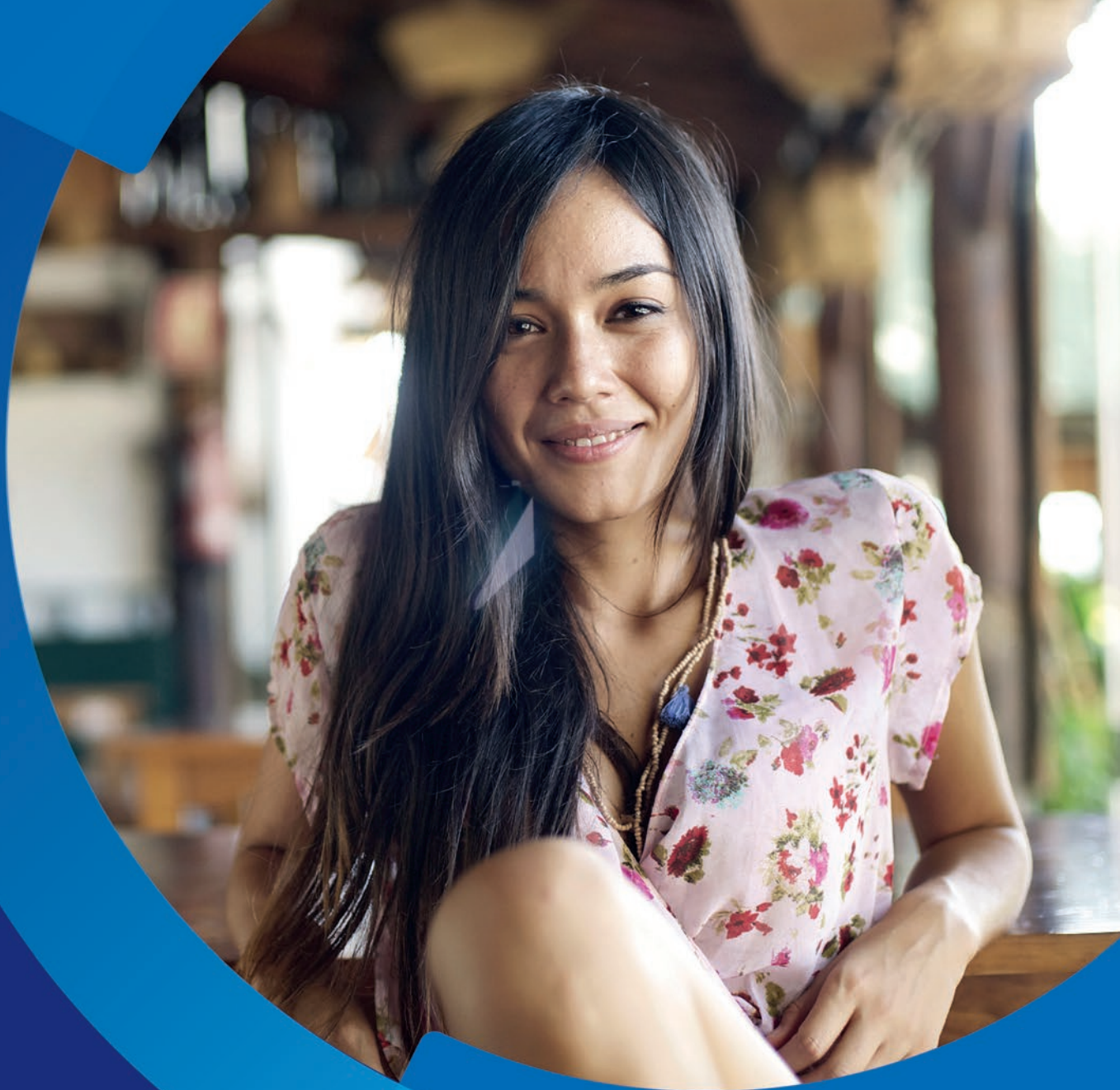
Tabela de Preços Bahia

Válida a partir de 14 de janeiro de 2019